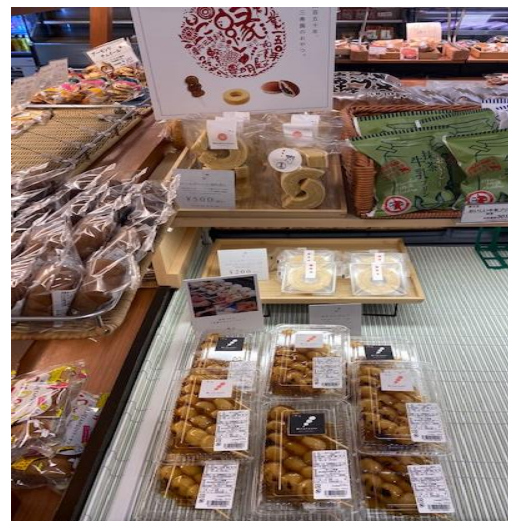
ハイウェイオアシス刈谷