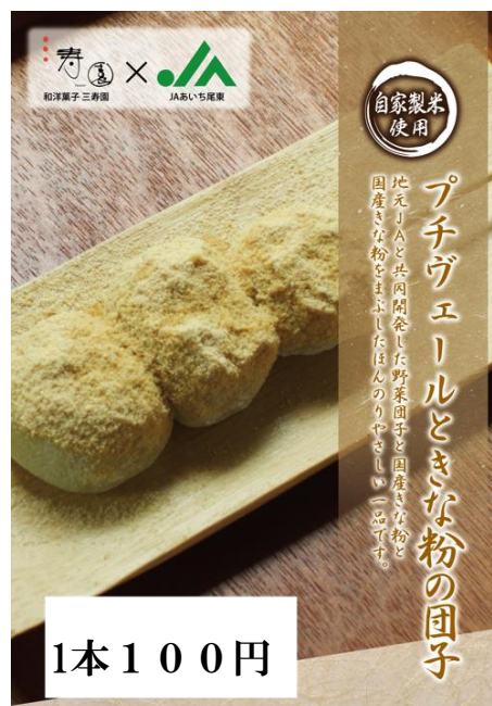
プチヴェールを 練り込んだ団子