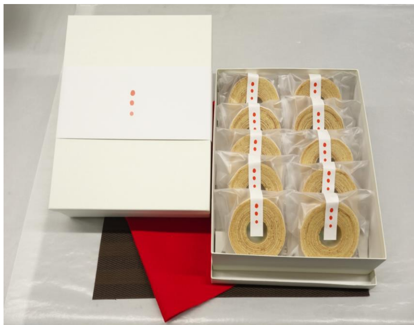
ばーむくーへん 小丸 (10個入り)