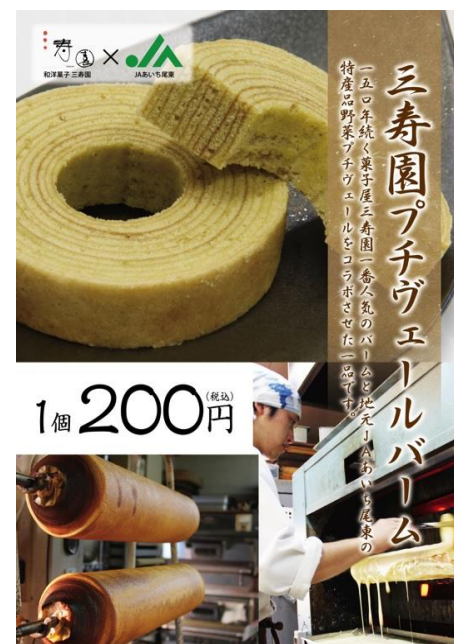
プチヴェールを 練り込んだバーム