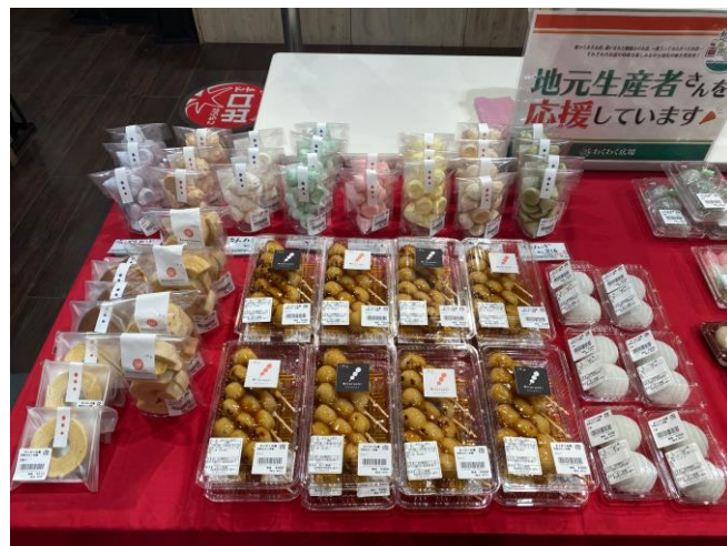
イオン 東浦・三好